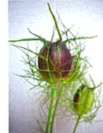
ニゲラの実【キンポウゲ科クロタネソウ属】