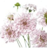
スカビオサ【マツムシソウ科マツムシソウ属】