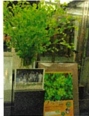
グypsophila【セリ科シマサイコ属】