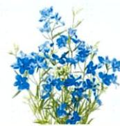
デルフィニウム【キンポウゲ科デルフィニウム属】