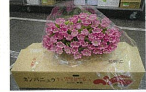
カンパニュラ【キキョウ科ホタルブクロ属】