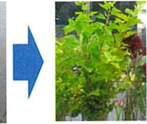
キバデマリ【バラ科デマリシモツケ属】