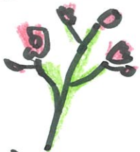
カーネーション (ステレタリ) 1本