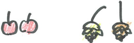
ヒメリンゴ×2 ヌ マツボックリ×2