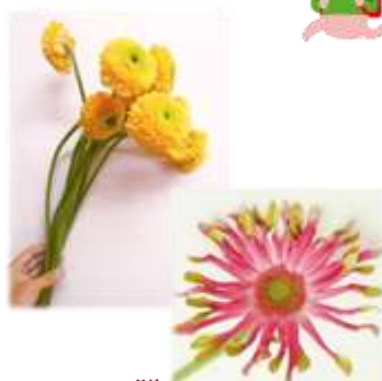
←ガーベラを育てているところ